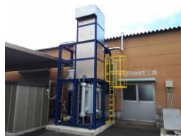
廃食用油再生プラント

従来のバイオディーゼル燃料（BDF）は、利用できる車両が旧型エンジンに限られていたことから、軽油と同等質の高品質バイオディーゼル燃料（HiBD）を精製できるプラントに更新した。HiBD 使用車両の実装は安定しており、今後も安定精製を続けていく。