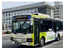
市営ラッピングバス