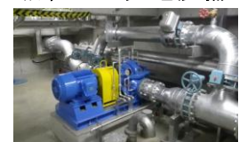
佐賀市清掃工場 小水力発電設備

佐賀市清掃工場では、機器を冷却するために循環している水を利用した小水力発電を行っており、発電した電気は電力会社を通して市内の小中学校に供給されている。