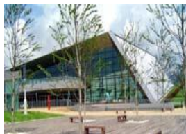
健康運動センター

ごみを燃やした熱は、廃棄物発電の他に、健康運動センター内の温水プールの水を温めることにも利用されている。温水プールで必要な熱は、全てごみを燃やした熱でまかされており、温水プールの運営にボイラー等を使用しないため、その分温室効果ガス排出量を削減している。