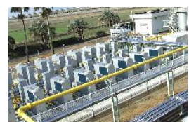
消化ガス発電設備

下水浄化センターでは、下水処理の過程で発生する消化ガスを使って発電し、発電した電気で、施設で使用する電力を補っている。また、発電設備の余熱を利用した消化槽の加温を行い、熱効率の向上を図っている。